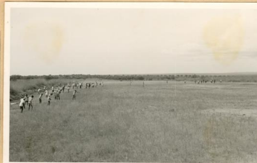
Dundo - Campo de aviação - Trabalho de aração e aumento.