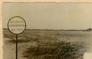
Dundo - Aeródromo.