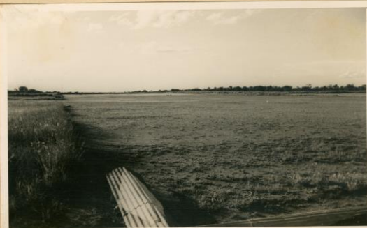
Dundo - Aspecto do campo de aviação.