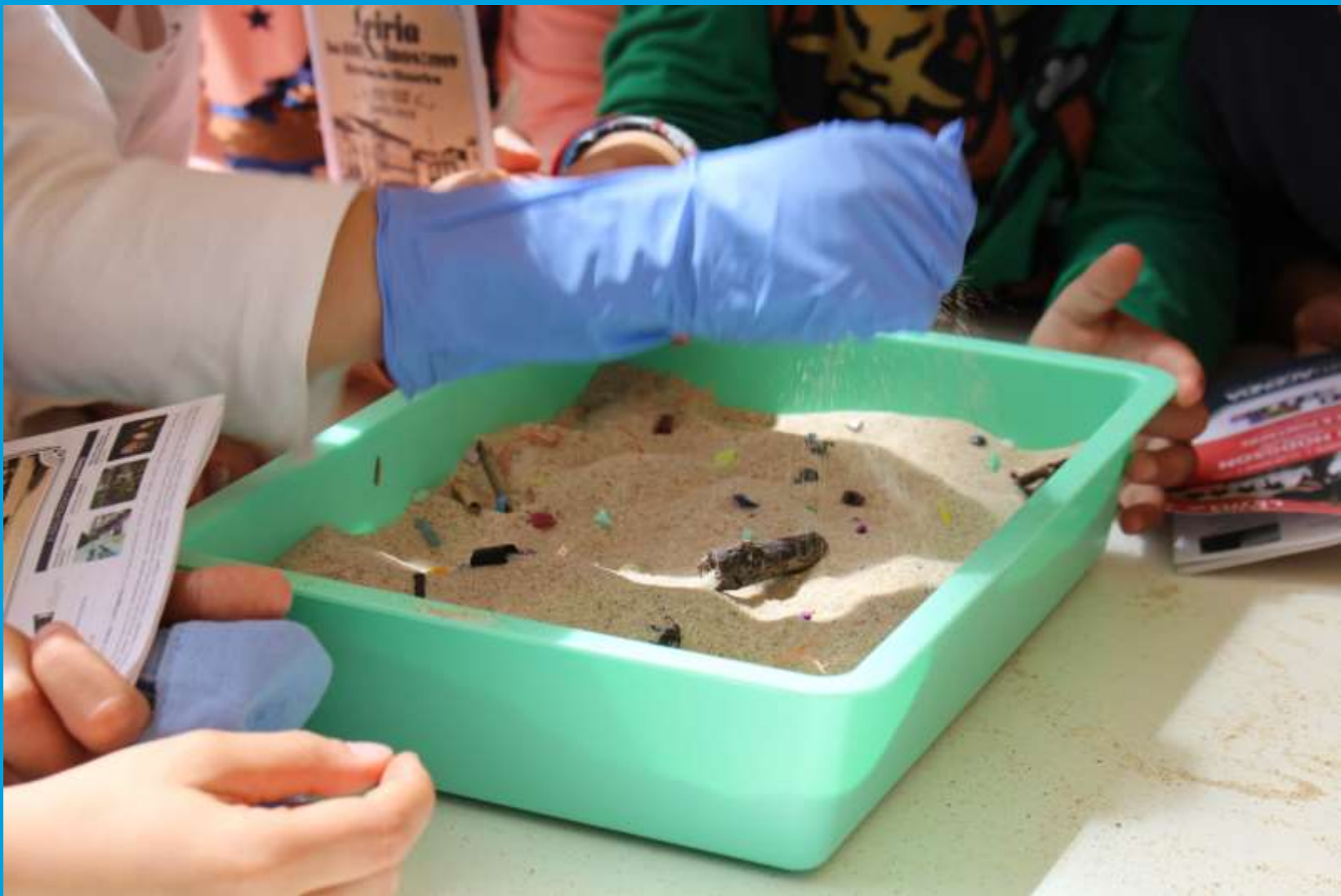
Oficina Pedagógica “Plásticos Marinhos”, com o CIA