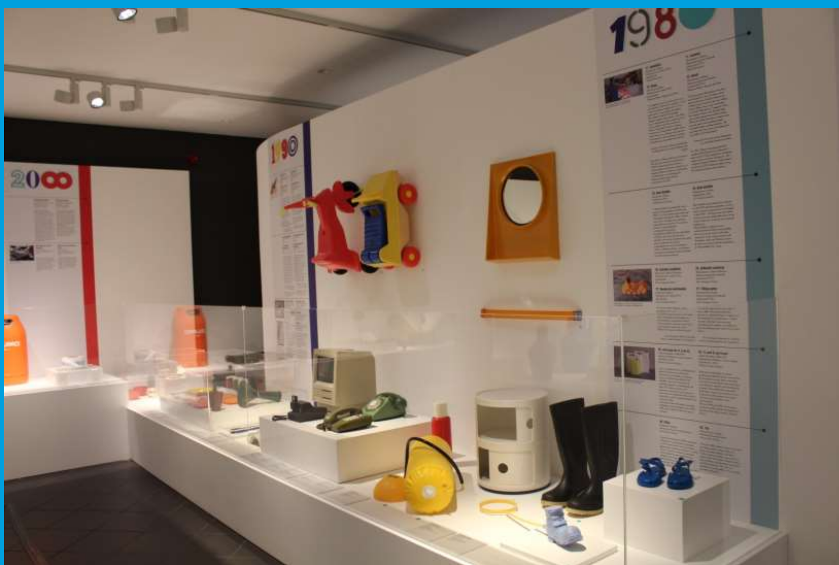
A exposição Plasticidade – acessibilidade gráfica; bilinguismo