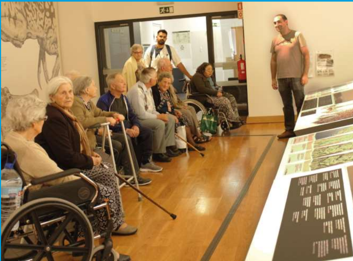
Público sénior – os amigos mais próximos do Museu